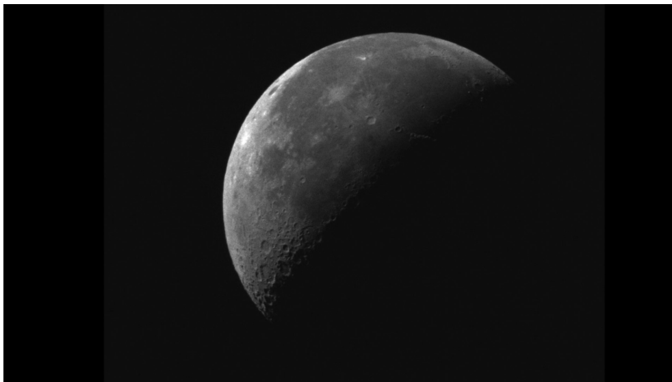
Tabita Rezaire, Waning Moon (Satellite Devotion) , 2019

Tabita Rezaire est une artiste d'anté-garde et prospective. En même temps attachée aux sols de nos boucles-époques imbues, elle en herse non pas les multi-réalités complexes, mais au contraire les germinations coloniales, hégémoniques et totalitaires — occidentalo-centrées, capitalistes, fascistes. C'est avec soin toutefois, qu'elle nous projette à travers la critique des outils de la technocratie afin, non pas de les exclure, mais de les re-cycler justement, de les faire dévier/éclater de la trajectoire univoque d'un individualisme oppressif/dépressif. Autrement dit, je décrirais sa pratique comme d'une thérapeutique technologique, à la fois cosmologique et de transmission.