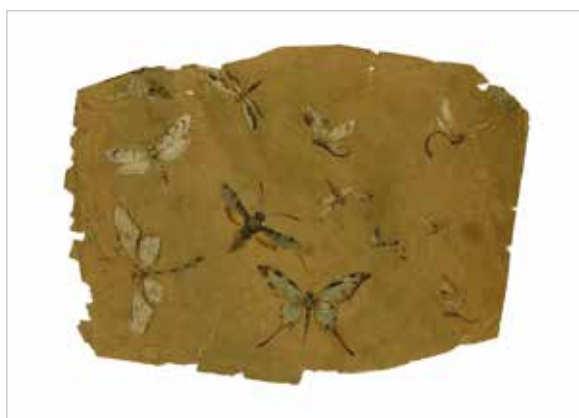
Eugène Kremer, Sans titre, non daté Dessin