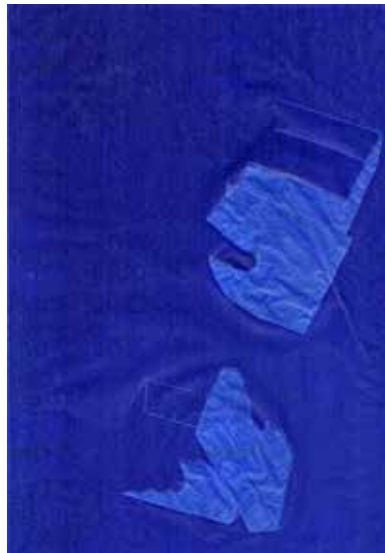
Julie Luzoir , Des mains et des boîtes – carbone , 2017 Dessin sur papier carbone