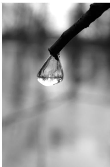
Jean-Claude Durmeyer , L'III aux trésors n°0028 , 2012 Photographie noir et blanc