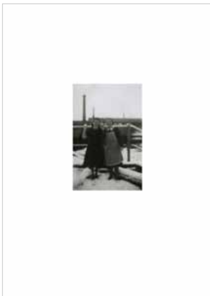
Anonyme , Archive familiale de Monsieur et Madame Jacob , non datée Photographie noir et blanc – Courtesy Monsieur et Madame Jacob