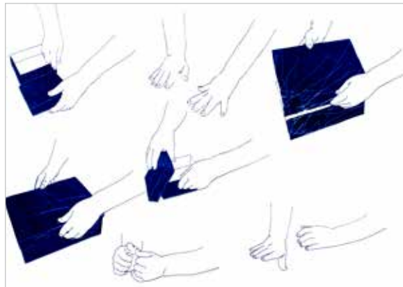
Julie Luzoir , Des mains et des boîtes , 2017 Dessin