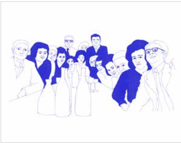
Julie Luzoir , Sans titre , 2017 Dessin – Courtesy Julie Luzoir