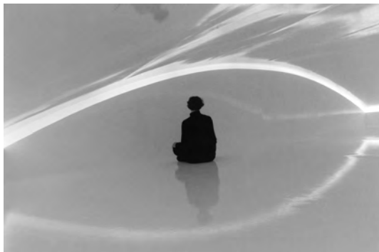
Tania Mouraud, Initiation room n°5 , 1969/1992. © l'artiste. ADAGP, Paris 2011

TOUS CES OUVRAGES SONT CONSULTABLES AU FRAC. N'HÉSITEZ PAS À VOUS ADRESSER À NOS MÉDIATEURS