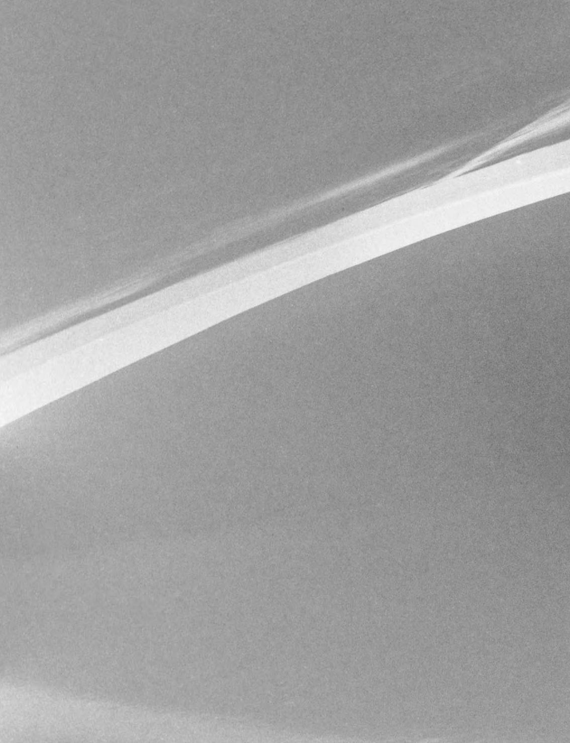
Tania Mouraud, Initiation room n°5 , 1969/1992. © l'artiste. ADAGP, Paris 2011