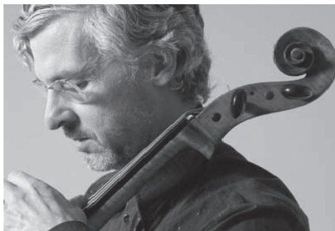
Charles Curtis