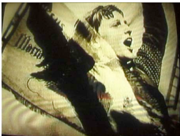
Jean-Baptiste Mathieu, Les visages de Jeanne , 2004

Accès : entrée libre. Ouverture juin - septembre, tous les jours, 14h30-17h30