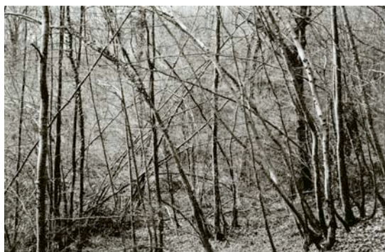
A. Claass, sans titre , 81-82, coll. Frac Lorraine

Espace foisonnant ou saturé, la nature semble ne pouvoir être contenue dans les dessins et les photographies présentées à l'Office du Tourisme. Tantôt mystérieuse, tantôt fascinante ou effrayante, la nature confère aux œuvres une vivacité et une densité forte qui témoignent de sa vitalité et de son énergie.