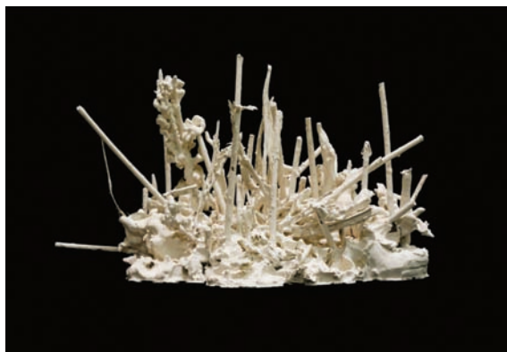
F. Génot, Les Îles , 2009

Accès : entrée payante. En mai, juin et septembre : ouverture week-end et jours fériés, 14h-18h. En juillet et août : tous les jours, 14h- 18h. (sauf mardi)