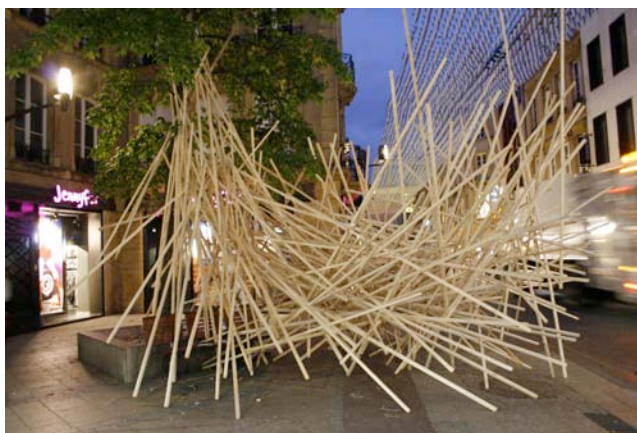
F. Génot, Junga N°5 , 2009.

ŒUVRES DE LA COLLECTION DU FONDS RÉGIONAL D'ART CONTEMPORAIN DE LORRAINE ET D'ARTISTES INVITÉS