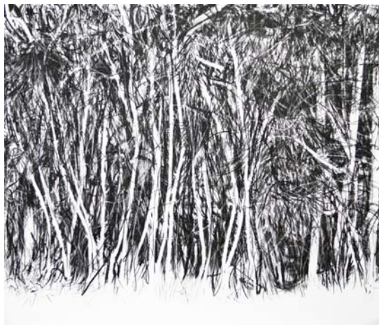
F. Génot, Dessin 03 , 2008 N°10 F. Génot

ŒUVRES DE LA COLLECTION DU FONDS RÉGIONAL D'ART CONTEMPORAIN DE LORRAINE ET D'ARTISTES INVITÉS