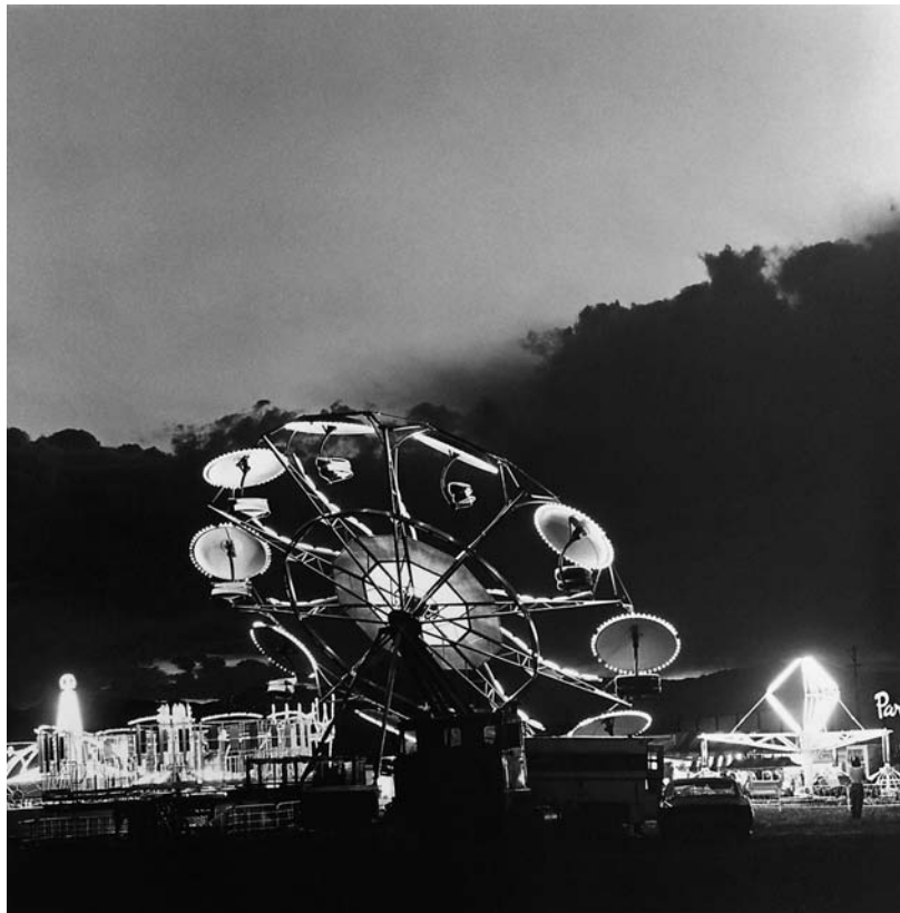
R. Adams, Summer nights # 2 , 1985. Coll. Frac Lorraine.

Accès : entrée libre. Ouverture au public le samedi 2 octobre, 14h-18h & sur rendez-vous.