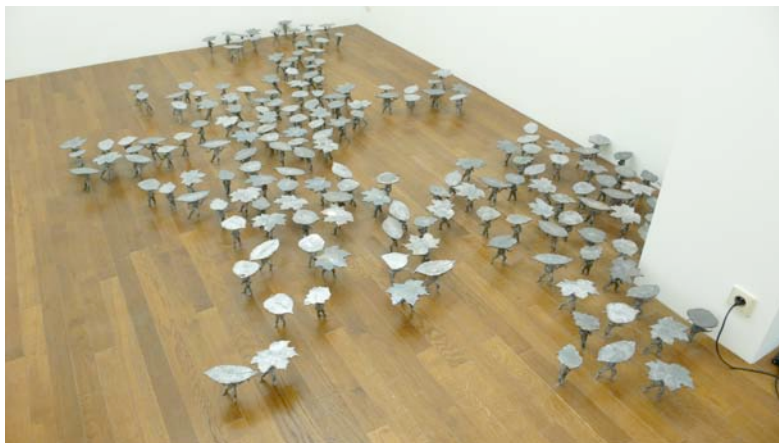
S. Gouju, Soldats , 2007

ŒUVRES DE LA COLLECTION DU FONDS RÉGIONAL D'ART CONTEMPORAIN DE LORRAINE ET D'ARTISTES INVITÉS