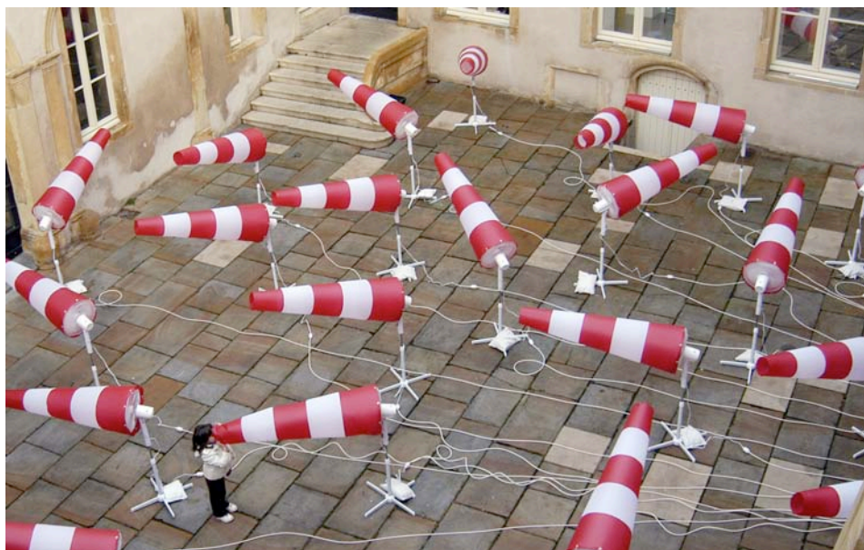
S. Usunier, Vents contraires , 2008. Production Frac Lorraine.

Accès : entrée libre. lundi à samedi, 10h-12h30 et 14h-18h.