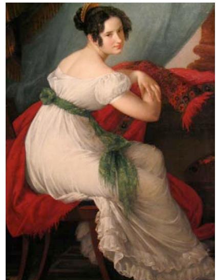
S. Lafont, Portrait N°11 , 1989. Coll. Frac Lorraine.