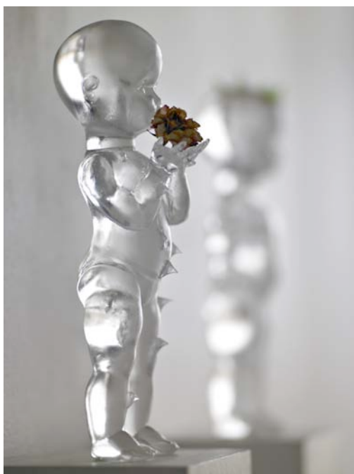
P. Neu, Poupée, Fleur, 2004. Coll. P. Neu

Accès : entrée payante. Ouverture juin - septembre, tous les jours (sauf mardi) 14h-18h Ouverture octobre, samedi & dimanche 14h-18h