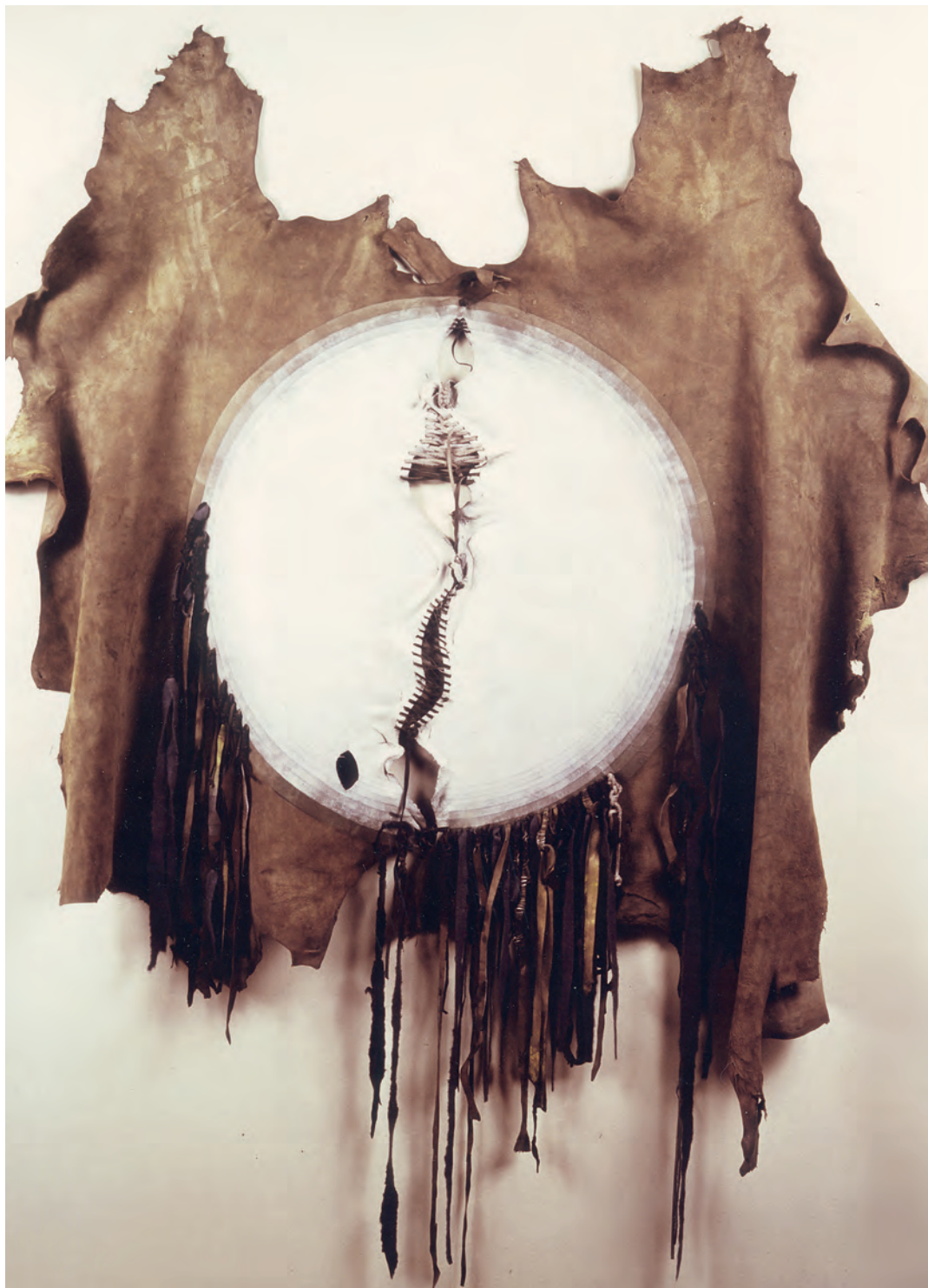
Nil Yalter, Topak Ev , 1973 (détail). Courtesy santralistanbul Collection & Nil Yalter