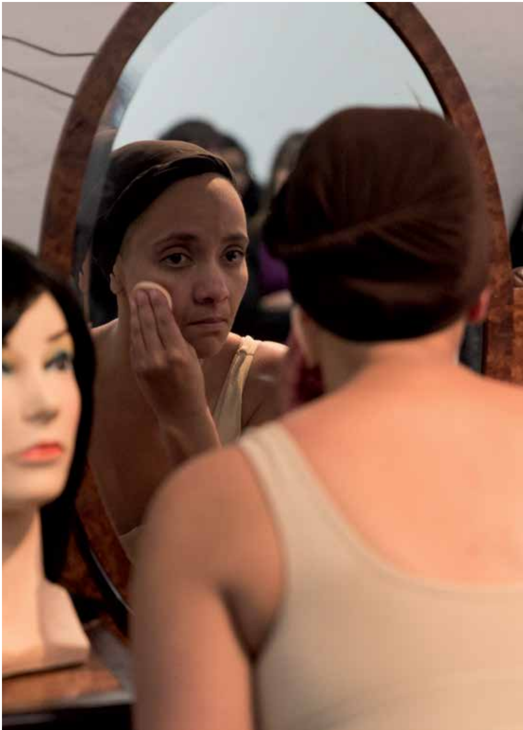
Miriam Syowia Kyambi, Fracture (1), 2011-15.