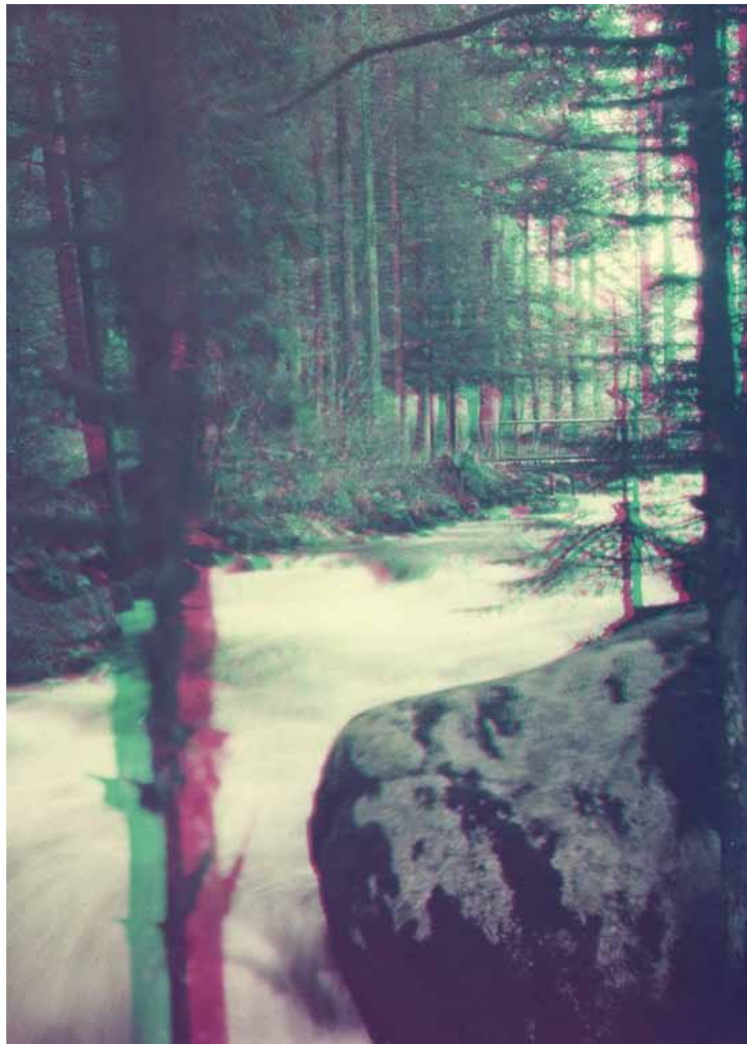
Image d'archive, La Vologne au Saut des Cuves à Gérardmer © Thouvenel (donateur) / @ La Conserverie www.cetaitoucetaiquand.fr

Partenaires: Centre Régional du Livre, Association AIDES 57, le Collectif - Ville de Metz, Librairie la Cour des Grands.