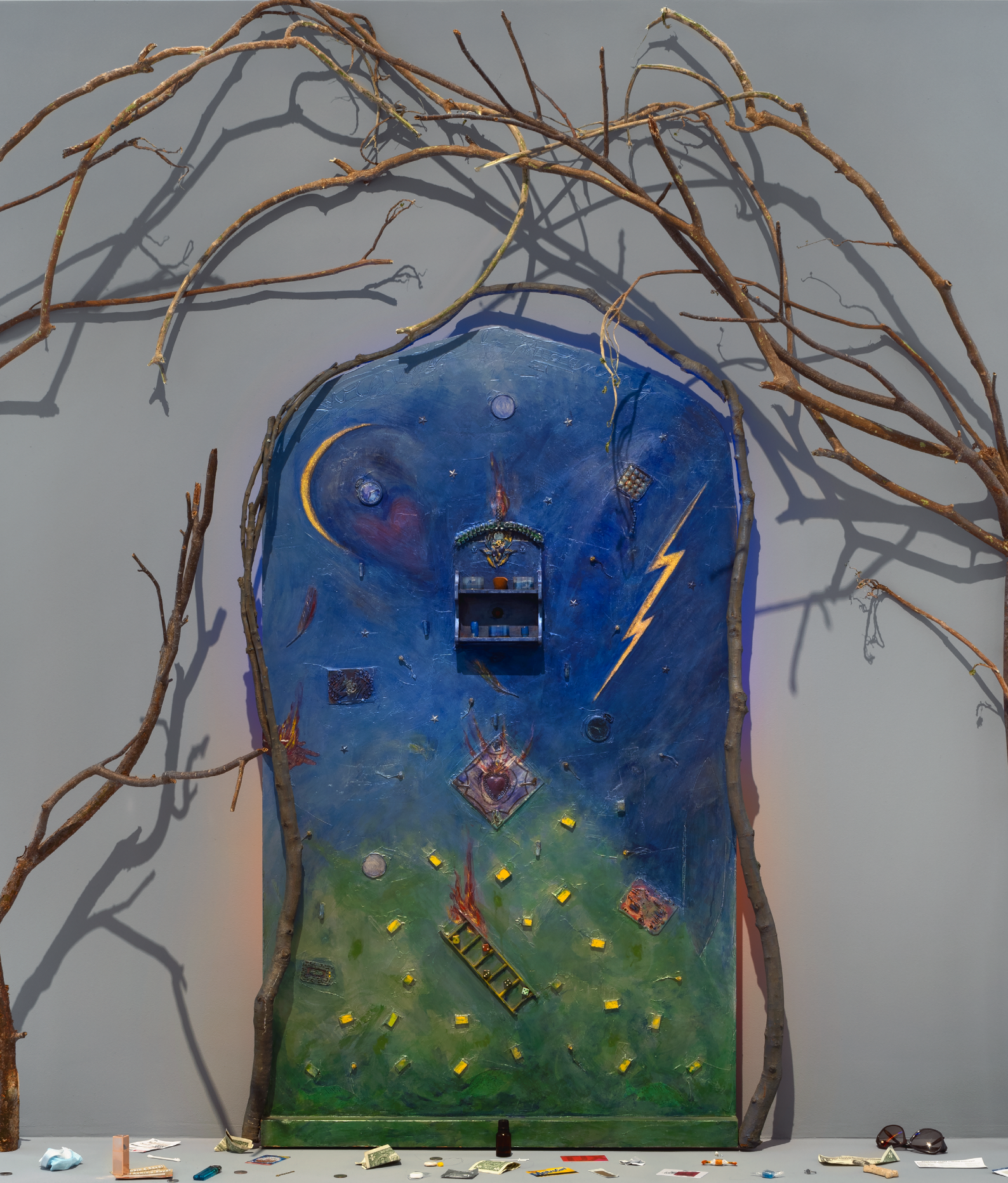
Betye Saar, Wings of Morning , 2019.