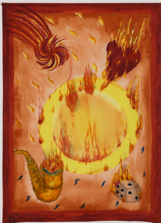
Betye Saar, House of Fortune (détail), 1988