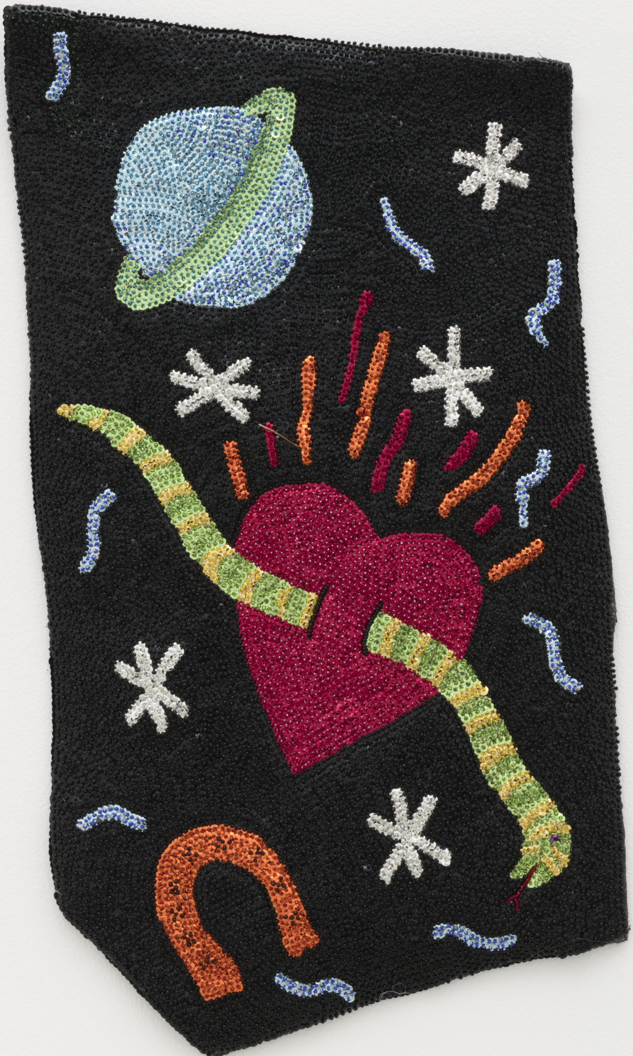
Betye Saar, Snake in the Heart , 1987, courtesy de l'artiste