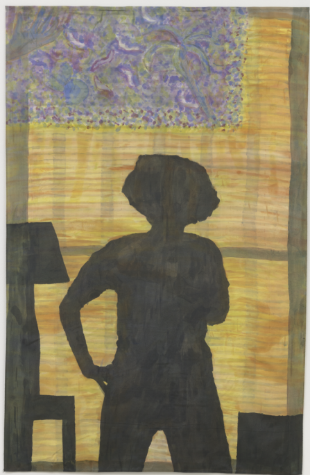
Betye Saar, Shadow Songs , 2019