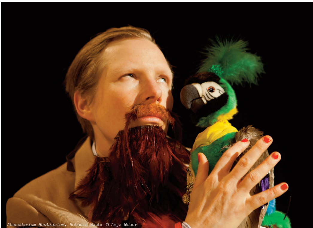
Abecedarium Bestiarium , Antonia Baehr