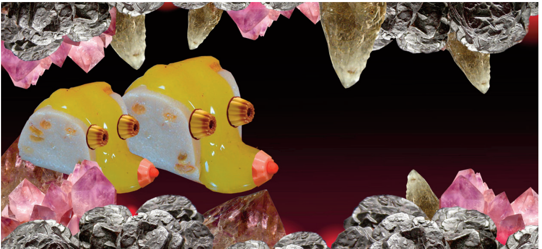
Le Club des chats, Ciné Boum . Coproduction Capitaine futur / Gaité lyrique-Paris

Que peut-il bien se passer dans la tête des chats lorsqu'ils ont leur quart d'heure de folie ? Réponse en son et en image par l'exploration d'une planète mystérieuse & un dj set animalier en compagnie de Capitaine futur. Rendez-vous pour une boum enflammée !