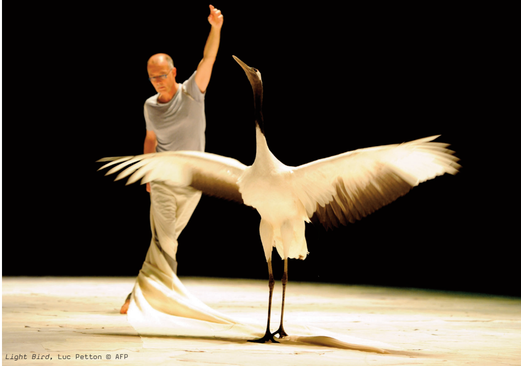
Light Bird , Luc Petton © AFP