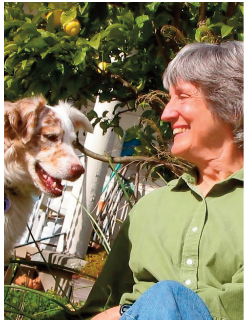
« Savoir résister à l'exception humaine exige de savoir résister à l'humanisation de nos compagnons ». Donna Haraway, auteure du célèbre Manifeste cyborg et son chien Cayenne : des relations à la base d'une réflexion sur nature et culture.

Que se passe-t-il quand une femme se met dans la peau d'un animal ? Peau d'Âne ? Pas seulement. Peut-être suffira-t-il de devenir une chienne pour que tombe la barrière entre « les deux genres », et aussi celle des espèces. Car après tout, la notion d'espèce n'existe tout simplement pas !