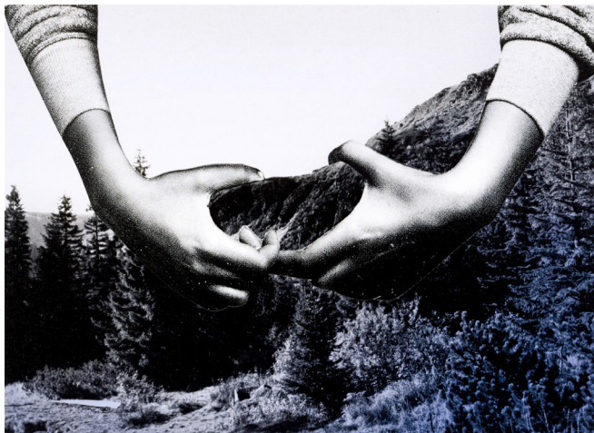
Emma Dajska, Peak n°12 , 2012

En complémentarité du projet pédagogique de l'enseignant.e, un temps de dialogue s'installe devant l'œuvre, incitant à la réflexion et à une mise en perspective du travail de l'artiste dans un contexte plus général.