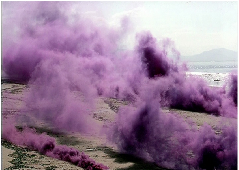
Judy Chicago, On Fire Atmospheres , 1969-2012,

En exploitant la thématique du jeu à travers les espaces, le temps, parfois le corps, les œuvres nous entraînent à changer notre regard sur le monde et à rentrer à notre tour dans la partie !